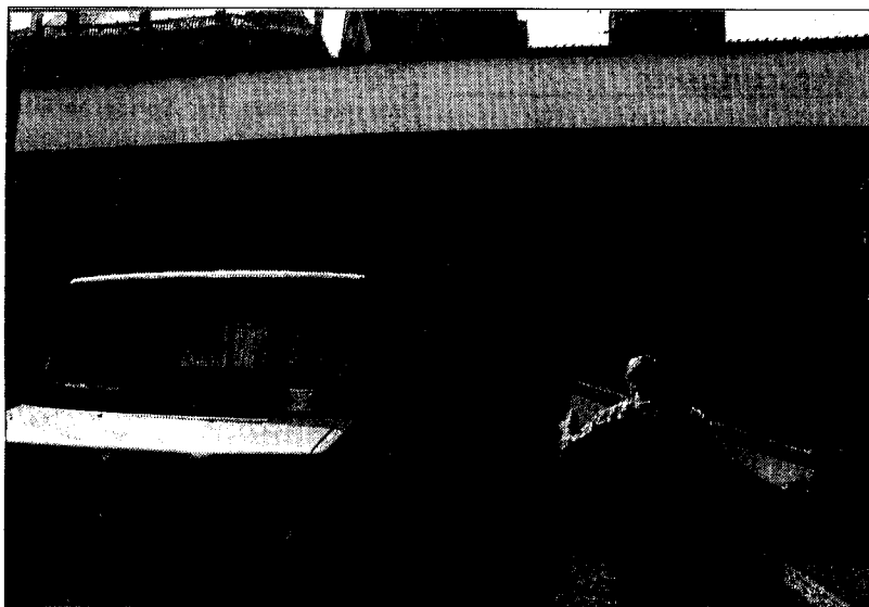
Die Heiligtumsfahrt ist vorbei. Die Abbauarbeiten auf dem Katschhof liefen bereits während der Schlussfeier im Dom.