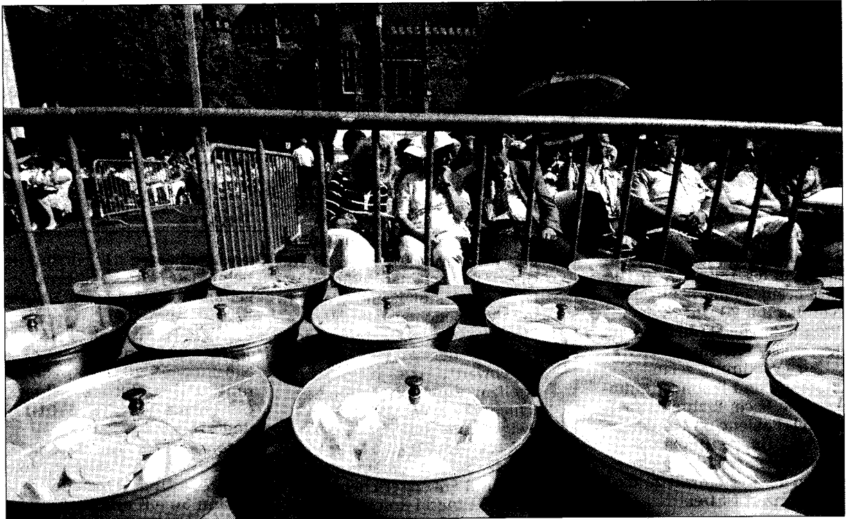
Das Brot des Lebens: Ganze Berge von Hostien liegen bereit. Sie müssen es auch, denn der Andrang zu den großen Pilgermessen auf dem Katschhof ist immens.