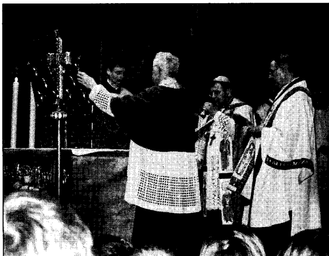
Nach der ersten Zeigung werden die Heiligtümer in eine Schmucktruhe auf dem Altar gelegt. Bischof Mussinghoff segnet sie mit Weihrauch.

Noch bis zu diesem Wochenende haben Pilger aus ganz Europa die Gelegenheit die Heiligtümer zu sehen und selbst mit ihnen auf „Tuchföhlung“ zu gehen. Dann werden die Stoffreliquien in einem speziellen Ritus wieder verpackt und im Marienschrein mit einem eigens dafür angefertigten Schloss für sieben Jahre verwahrt. Das Schloss wird mit Blei ausgegossen und der Schlüssel zerbrochen, bis im Jahr 2014 erneut die Gläubigen die Schläge zählen, die es braucht, um